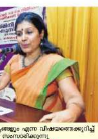
കേരളസ്ത്രീയും നവോത്ഥാന മുഖ്യങ്ങളും എന്ന വിഷയത്തെക്കുറിച്ച് അമ്മയുടെ അടുത്ത സഹോദരിയായും സംസാരിക്കുന്നു.